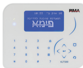
לוח מקשי מגע דק במיוחד (KLT500) מק"ט פימא 8415010